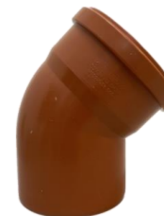
CODO 45° CXE