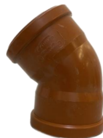
CODO 45° CXC